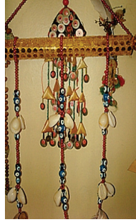
Resim 16: Çılkaklı Nazarlık (Balıkesir-Edremit-Tahtakuşlar Köyü Etnografya Galerisi)