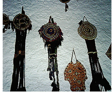
Resim 38: Devede Süsü (Çanakkale-Ayvacık-Behramköy)