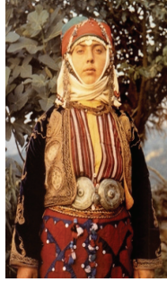
Resim 28: Geleneksel Giysiler (Bergama-Kapıkaya) (Tansuğ, S., (1985), Türkmen Giyimi , İstanbul: Akbank Yayınları.)