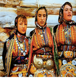
Resim 33: Geleneksel Giysiler (Sivas-Zara) (Tansuğ, S., (1985), Türkmen Giyimi , İstanbul: Akbank Yayınları.)