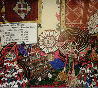
Resim 25: Top ve Bel Bağ 1 (Balıkesir-Edremit-Tahtakuşlar Köyü Etnografya Galerisi)