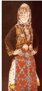
Resim 30: Geleneksel Giysiler (Bergama-Kapıkaya) (Tansuğ, S., (1985), Türkmen Giyimi , İstanbul: Akbank Yayınları.)