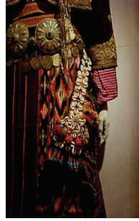
Resim 32: Bergama Yöresi Kadın Giysisi (Bergama Müzesi)