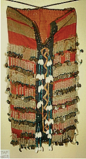
Resim 39: Nazarlık Torba (Balıkesir-Edremit-Tahtakuşlar Köyü Etnografya Galerisi)