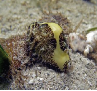
Resim 1: Çılkak ( Cypraea moneta ) http://www.scuba-equipment-usa.com/marine/JUL06/thumbs/Cypraea_moneta.jpg