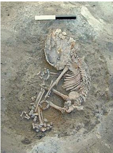
Resim 5: Çatalhöyük kız mezarı (Türkiye) http://www.geocities.com/arkeoloji2000/catalgale_ri.htm