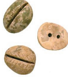
Resim 10: Yeşimtaşı çılıkak M.Ö. 1051–221 (Çin) http://www.calgarycoin.com/reference/china/china1.htm