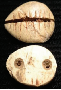
Resim 9: Kemik çılıkak M.Ö. 2500 (Çin) http://www.calgarycoin.com/reference/china/china1.htm