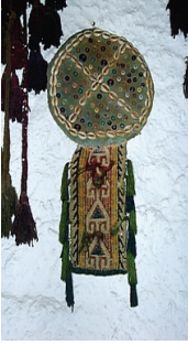
Resim 37: Devede Süsü (Çanakkale-Ayvacık-Behramköy)