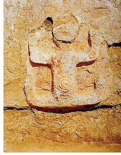
Resim 22: Anatanrıça (Çatalhöyük) Mellaart J., (2003), Çatalhöyük Anadolu'cu Bir Neolitik Kent , Çeviren: Gökçe Bike Yazıcıoğlu, İstanbul: Yapı Kredi Yayınları.)