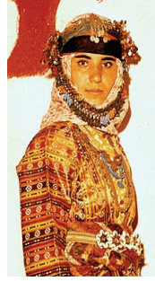
Resim 34: Geleneksel Giysiler (Muğ la- Çiçekliev) (Tansuğ, S., (1985), Türkmen Giyimi , İstanbul: Akbank Yayınları.)