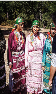
Resim 29: Tahtacı Türkmenleri (Çanakkale Ayvacık-Çiftlik Köyü)