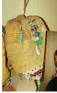
Resim 20: Çılkaklı Nazarlıklı Kız Başlığı (Balıkesir-Edremit-Tahtakuşlar Köyü Etnografya Galerisi)