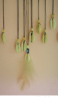
Resim 19: Çılkaklı Nazarlık Kolye (Balıkesir-Edremit-Tahtakuşlar Köyü Etnografya Galerisi)