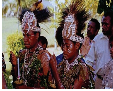
Resim 8: Tören Giysileri (Papao Yeni Gine) http://www.muszle.concha.pl/?id=4&a=24 http--www.muszle.concha.pl-gfx-24-image005.jpg