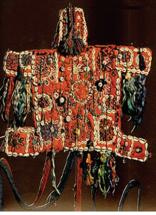
Resim 21: Nazarlık (Karadeniz Yöresinden) (Aşler M., (1977), “Kenan Özbel Halk El Sanatları Müzesi”, Sanat Dünyamız , Sayı: 10, İstanbul: Yapı ve Kredi Bankası Yayınları)