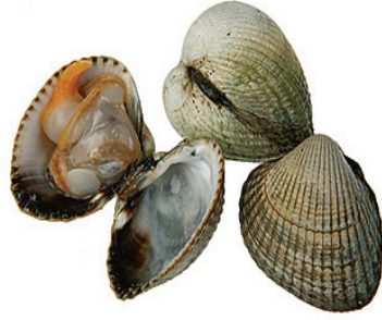
Resim 4: Cardium edule http://www.shellfish.org.uk/images/cockles.jpg