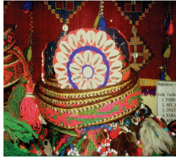
Resim 24: Top ve Bel Bağ (Balıkesir-Edremit-Tahtakuşlar Köyü Etnografya Galerisi)