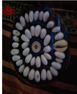
Resim 18: Çılkaklı Nazarlık (Balıkesir-Edremit-Tahtakuşlar Köyü Etnografya Galerisi)