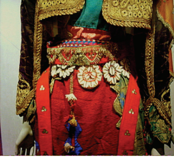
Resim 31: Bergama Yöresi Kadın Giysisi (Bergama Müzesi)