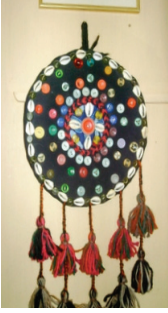
Resim13: Çılkaklı Nazarlık (Balıkesir-Edremit-Tahtakuşlar Köyü Etnografya Galerisi)