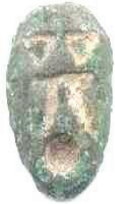
Resim 11: Çılıkak biçimli bronz para (Çin) http://www.calgarycoin.com/reference/china/china1.htm