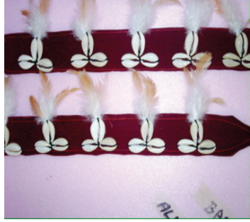
Resim 26: Top ve Bel Bağ 1 (Balıkesir-Edremit-Tahtakuşlar Köyü Etnografya Galerisi)