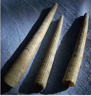
Resim 3: Dentalium http://donsmaps.com/images8/dentalium.jpg