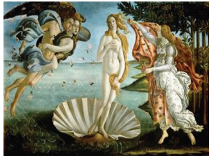
Resim 6: Afrodite (Botticelli) http://www.tebe.org/tr/dosyalar/mitoloji/aphrodite.htm