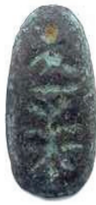
Resim 12: Çılıkak biçimli bronz para (Çin) http://www.calgarycoin.com/reference/china/china1.htm