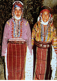
Resim 27: Geleneksel Giysiler (Bergama-Üsküdarlı) (Tansuğ, S., (1985), Türkmen Giyimi , İstanbul: Akbank Yayınları.)