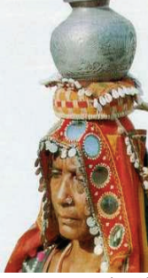
Resim 7: Banjara'lı Kadın (Banjara-Hindistan)