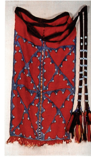
Resim 40: Çılkaklı Bel Bağ ı (Tansuğ, S., (1985), Türkmen Giyimi , İstanbul: Akbank Yayınları.)