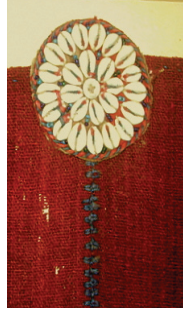
Resim14: Çılkaklı Nazarlık (Balıkesir-Edremit-Tahtakuşlar Köyü Etnografya Galerisi)