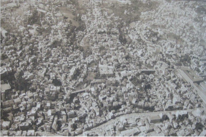
Şekil 1: Tabakhane ve Zağnos Vadileri (Bölükbaşı, 2006)

Bol akarsular ve vadilerin bulunduğu Trabzon'da geçmişten günümüze birçok köprü yapılmışsa da, bunlardan pek azı günümüze kadar gelebilmiştir. Bunların arasında en önemlileri Zağnos ve Tabakhane köprüleridir. Bu iki köprü kent için işlevsel olduğu kadar kültürel açıdan da önemlidir. Bu köprüler sadece ulaşım amaçlı değil savunma, su yolu olarak ta kullanılmışlardır. İlk yapılış tarihleriyle ilgili kesin bir bilgi olmayan bu köprüler, geçirdikleri tarihi dönemlerin izlerini taşımaktadır. Taşıdıkları bu izlerle ve konumları itibariyle köprü olmaktan öte kent için önemli iki değer olmuşlardır. Köprüler doğusu ve batısı, Kuzgundere, İmaret Deresi ve vadilerle çevrelenen eski kentle bir yandan bağlantıyı sağlarken diğer taraftan da savunma amaçlı olarak dış mahallelerle bağlantısının kesilmesini sağlamaktaydılar ( Şekil 1 ).