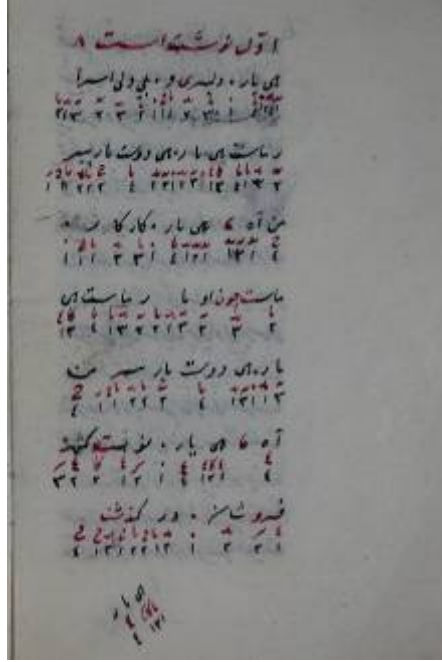
Belge 4: Nasır Dede'nin müzik yazısına örnek (3. Selim'in Suzidilara Mevlevî Ayini'nin ilk sayfası, Esad Efendi vr.6b)

Abdülbaki Nasır Dede'nin müzik yazısının özelliklerini şöyle sıralayabiliriz: