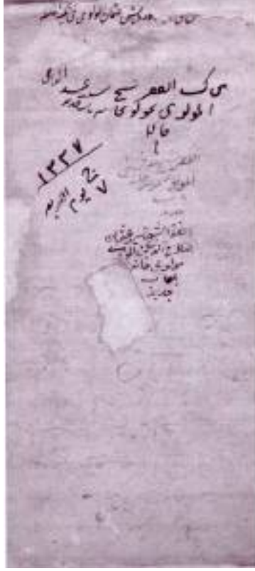
Belge 1 (Nayi Osman Dede'nin kitabından iç kapak)

Popescue-Judetz'in üç bölümden oluşan Türk Kültürünün Anlamları adlı kitabının "Nota Yazım Türleri" başlıklı birinci bölümünde yazar, Nâyi Osman Dede'nin kitabını Süralsan'da iken kısa bir süre görme şansını elde etmiş ve kitabın tanıtımını yaparak müzik yazısı hakkında bize oldukça önemli ve yeni bilgiler sunmuştur. Popescue-Judetz, bu müzik yazısının Kantemiroğlu müzik yazısına benzediğini açıkça yazmaktadır [Popescu-Judetz, 1996: 38-39] ancak bu eserden bir örnek dahi göstermesi mümkün olamamıştır. Dolayısıyla Popesque Judetz'in çalışmasında da detaylı inceleme şansı olmadığından bazı eksik bilgiler bulunmaktadır.