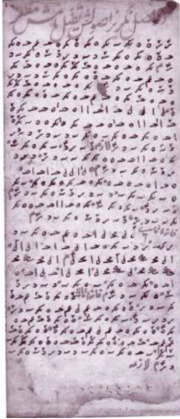
Belge 2: Nayi Osman Dede'nin Mecmuası'ndan bir Müzik yazısı örneği (Der fasl-ı nikriz, usuleş sakil, Muzaffer )

Burada kısaca elimizdeki eserlerden çıkardığımız özellikleri az önceki kaynaklarda belirttiğimiz tekrarlanan eksik ve hatalı bilgileri düzeltebilmek amacıyla şu alt başlıklar altında toplayabiliriz.