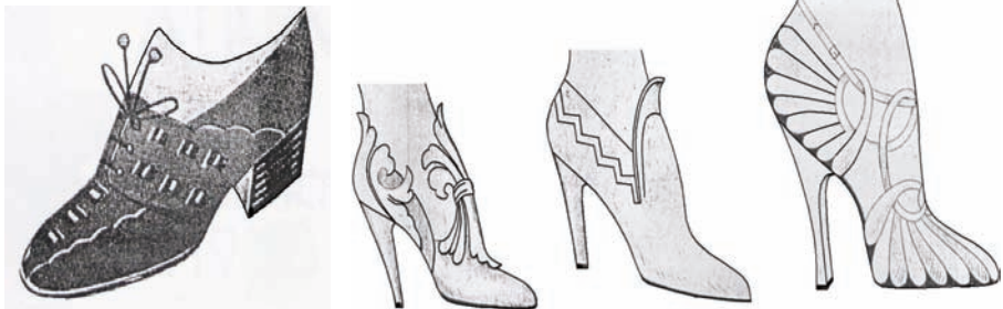
Resim 22: (Moda Albümü, 1938 İskarpın Modası, İsmail Kemal Güzelaydın)

1938-1939 yılları arasında ise iskarpinlerdeki moda olan değişiklikler takip edilerek kunduracılar tarafından müşterilerine sunulmuştur (Anonim, 1938; 29).