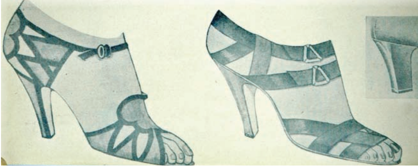
Resim 17: (Moda Albümü, 1936 Yaz İskarpin Modası, İsmail Kemal Güzelaydın)

O dönemin bir başka maruf kunduracısı ise, Bay Nuri'dir. Bay Nuri 1936 yılı yaz iskarpin modasına ilişkin görüşlerini şöyle açıklar. Spor iskarpinlerin topukları dört köşeli oldu fakat yüksek topuklara henüz sirayet etmedi. Dört köşeli topuklar ayakta bir kalabalık verecek korkusu ile tutmayacaktır. Deride ise açık bej rengi glâse çok moda, hatta erkeklerde bile kullanıyoruz. Yılan derisi artık moda çerçevesinden çıkmıştır. Bu sene en çok kurbağa derisi kullanıyoruz. Geçen sene olduğu gibi bu senede sandalet gerek gece, gerekse gündüz ve plaj giyilecek (Anonim, 1936; 13).