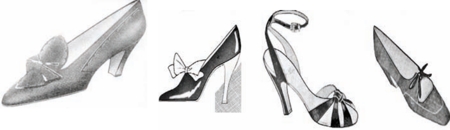
Resim. 19: (Moda Albümü, 1936 Kış İskarpin Modası, İsmail Kemal Güzelaydın)

şasonlara tercih edeceklerdir. Giyilecek derilerin en gözdesi antilop olacaktır. Tıpkı elbiselerde bu sene olduğu gibi, iskarpin derilerinde de parlak ve açık renk modası yoktur. (Anonim, 1936: 22-23).