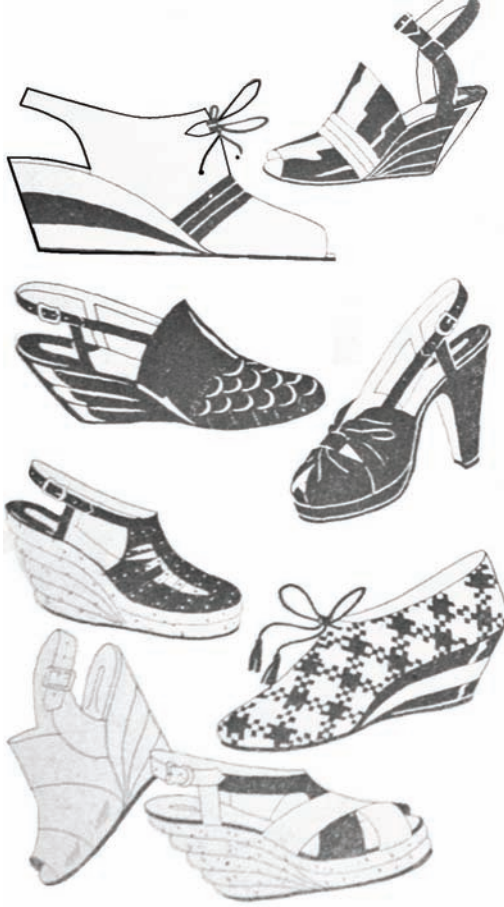
Resim. 23: (Model Mecmuası, 1942, İskarpin Modası)

Ayakkabıda 1940'lı yıllarda ayakkabı modellerinde rahatlık ön plana çıkarak sadece Avrupa modası değil, Amerikan modası da takip edilme-ye başlamış ve değişim ve yenilikler ayakkabı modellerine yansıtılmıştır (Anonim, 1942; 1).