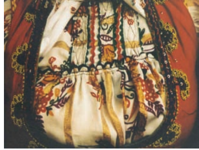
Şekil 5: Yelek örnekleri, Azdavay merkez