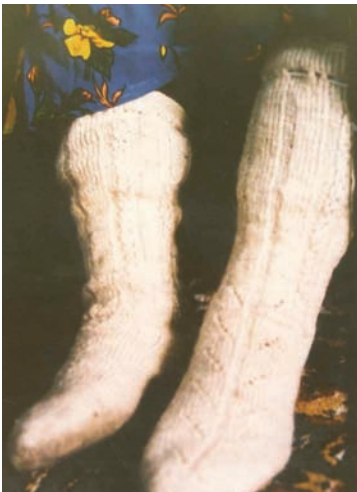
Şekil 6: Kazıl Çorap

Yörede kazıl çorabın üzerinde kullanılan bazı motiflerin kiraz dalı, ayna kapağı, kaz ayağı, burma, kesme cici, saç örgüsü olduğu belirlenmiştir. Yine yörede kazıl çorap üstünün renkli ipliklerle süslenmesinden elde edilen çoraba da 'cicili çorap' adı verilmektedir.