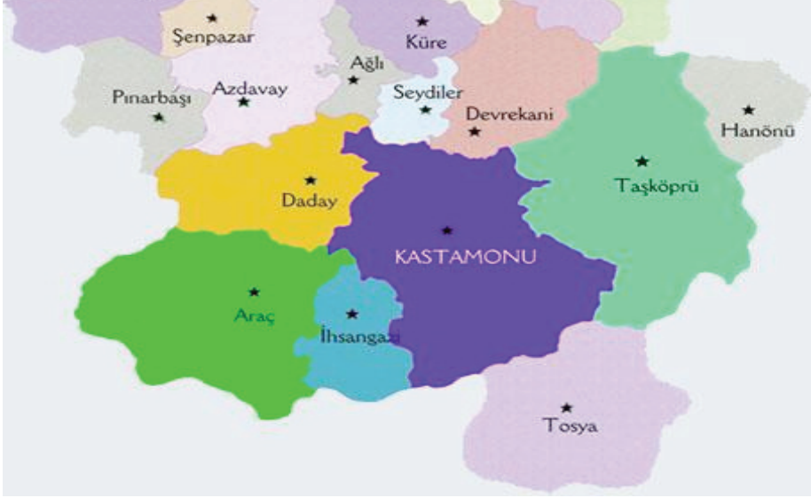
Şekil 1: Kastamonu il haritası

Günümüzde kullanılan geleneksel giyim elemanları ve özellikleri başa giyilenler, içe giyilenler, dışa giyilenler, ayağa giyilenler ve giyim aksesuarları şeklinde sınıflandırılarak ele alınmıştır.