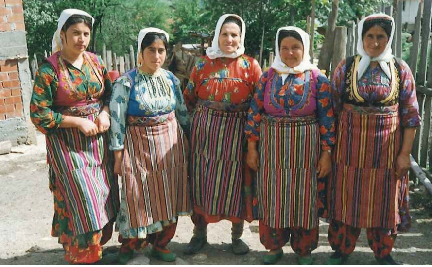
Şekil 4: Başörtünün bağlanış biçimleri, Dereyücek köyü, Azdavay

Fes, çember, kuşak, ön bezi gibi bazı geleneksel giyim elemanlarının kısmen kullanımının devam ettiği, Daday ilçe merkezine 60 km uzaklıkta bulunan Selalmaz kazasının bazı köylerinde özellikle yaşlılar arasında baş giyiminde fes ve çember kullanımının yaygın olduğu görülmektedir. Karton üzerine bordo renk çuha kumaş kaplanarak hazırlanan feslerin üzerine “çökü” bağlanarak kullanılmaktadır. Fesin üzerine yörede el tezgahlarında dokunan çemberler kullanılmaktadır. Çember rengi mevsimlere göre değişiklik göstermekte, yazın beyaz, kışın yeşil çember kullanılmaktadır. Bazı dağ köylerinde yaz kış yeşil çember kullanılmaktadır.