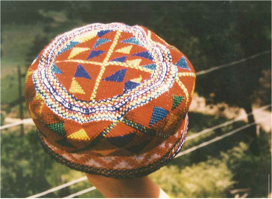
Şekil 3: Üzeri kaneviçe tekniğiyle işlenmiş takke, Yumacık köyü, Azdavay

Takkenin baştan kaymaması için, çenenin altından ve kulakların önünden ya da arkasından geçerek, tepede bağlanan takıya “ çene ipi ” denilmektedir. Yörede çene ipi “çene boncuğu, imik bağı, inek bağı” gibi isimlerle de anılmaktadır. Yörede kullanılan çene ipi, ufak boncukların ipe geçirilmesiyle hazırlanmaktadır. Boncuk dizisinin sayısı kişinin zevkine ve ekonomik durumuna göre değişmektedir. Yaşlı ve ekonomik durumu iyi olmayan kadınların bu amaçla kumaş şerit kullandıkları da belirlenmiştir. Şenpazar köylerinde kırmızı renk boncuklardan yapılan çene ipinin tercih edildiği görülmektedir.