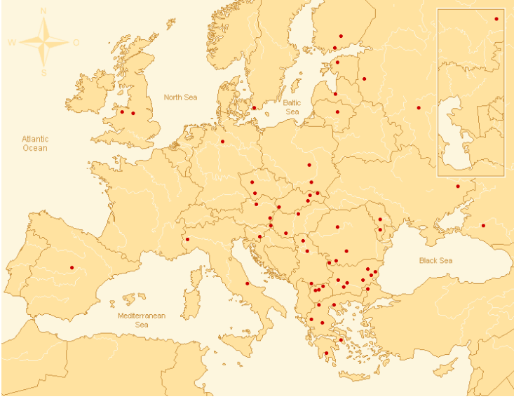
Resim 1: Romanî Konuşulan Bölgeler (Yaron Matras) 1