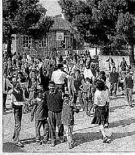
Öğrenciler artık daha başarılı...